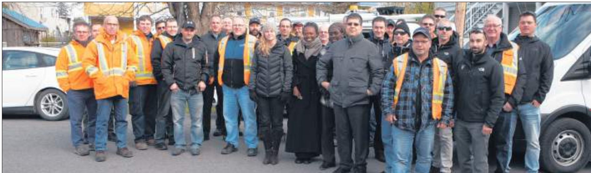
Une partie des participants à la rencontre tenue à Saint-Jean.

La semaine dernière, pour pimenter la rencontre, une compétition de détection d'une fuite a été organisée entre les participants. Dans le cadre de son programme préventif, le Service des travaux publics a déjà décelé une fuite sur la 2 e Rue, à Iberville. En utilisant les différents outils, les participants devaient établir le plus exactement où elle se trouve. La réparation doit se faire sous peu. En excavant le sol, les cols bleus trouveront l'emplacement exact. On saura alors qui a gagné.