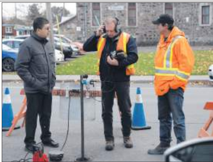
Différents outils servent à déceler une fuite d'eau. Ils ont en commun d'utiliser le son pour déterminer l'emplacement.

La semaine dernière, 45 représentants des villes de Montréal, Québec, Laval, Sherbrooke, Beloeil, Brossard, Saint-Bruno et Saint-Eustache ont participé à la rencontre, indique M. Duquet. Ils ont échangé précisément